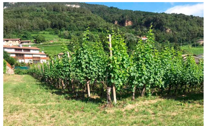
In der Kalteggstraße wird die neue Mischzone „Ludwig“ realisiert

Interessierte können ab sofort Gesuche um die Zuweisung von gefördertem Bauland in der neuen Mischzone in der Kalteggstraße einreichen. Letzter Termin ist Freitag, 28.06.2024. Das