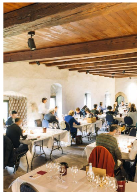
Alle Weinliebhaber, die sich selbst ein Bild der teilnehmenden Weine machen wollen, können diese im Klösterle von Laag verkosten.