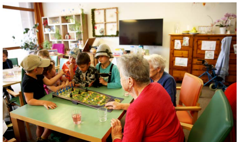
Spiel und Spaß für Jung und Alt

schenkt. „Das Bild ist für dich, das kannst du in deinem Zimmer aufhängen!“ „Jo, sel wer i gonz gern tian!“ Und so bleibt auch dieser Besuch der Waldkinder sicherlich in langer und guter Erinnerung.