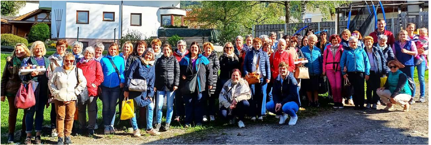
Frühlingsfahrt der SBO nach Lans: Ein Tag voller Begegnungen

Die Frühlingsfahrt der SBO führte heuer nach Lans in Tirol. Die Gemeinde Lans, südöstlich von Innsbruck gelegen, ist seit 2022 Partnergemeinde von Montan. Mittlerweile ist die Partnerschaft wirklich mit Leben gefüllt und davon konnten auch wir uns bei unserem Besuch überzeugen.