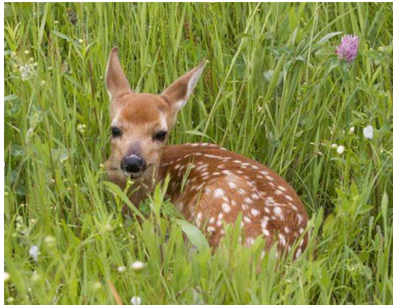
Hunde an die Leine! - Schutz für Wildtiere in der Brut- und Setzzeit