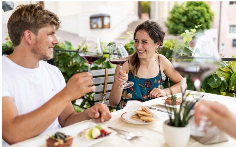
Bei einem Glas Blauburgunder Gaumenfreuden genießen

Alle Informationen zum Programm finden Sie auf www.castelfeder.info