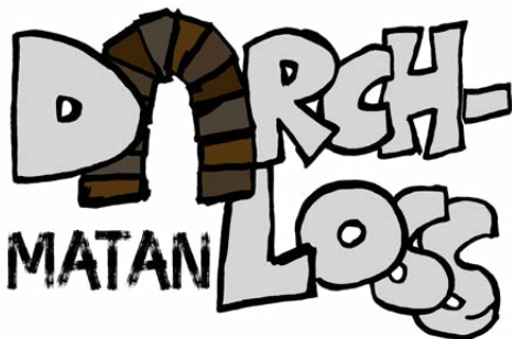
Das Logo unseres Jugendtreffs „Durchloss Matan“

Der Gemeindeausschuss hat die Weiterführung der Anstellung eines/er Projektmitarbeiters/in des Jugenddienstes Unterland für den Jugendtreff in Montan für den Zeitraum Jänner – Dezember 2024 genehmigt. Die Kosten in Höhe von 8.000 € wurden genehmigt und ausbezahlt. Dies sind 50% der Gesamtkosten, der Rest wird vom Landesamt für Jugendarbeit finanziert.