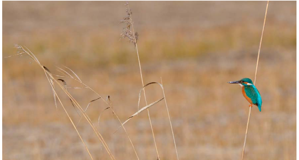
Der Eisvogel in seinem Lebensraum