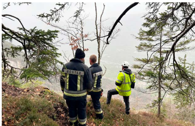
Feuerwehrleute und ein Landesgeologe an der Kante der Rutschung am Cisloner Berg