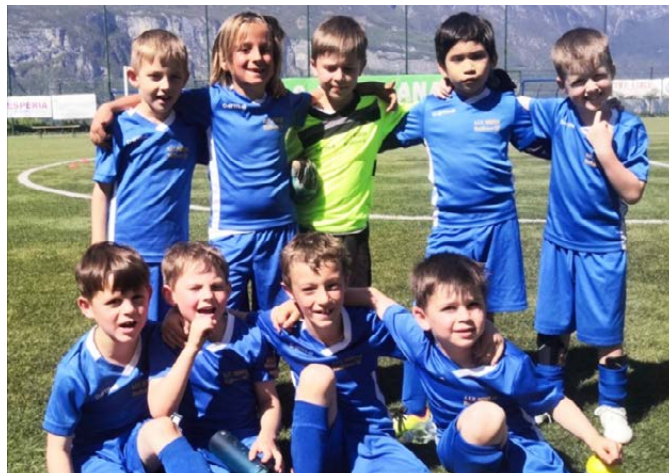
Die Kinder der Fußballschule

Raiffeisen Raiffeisenbank Südtirol Cassa Raiffeisen Banca Alpina