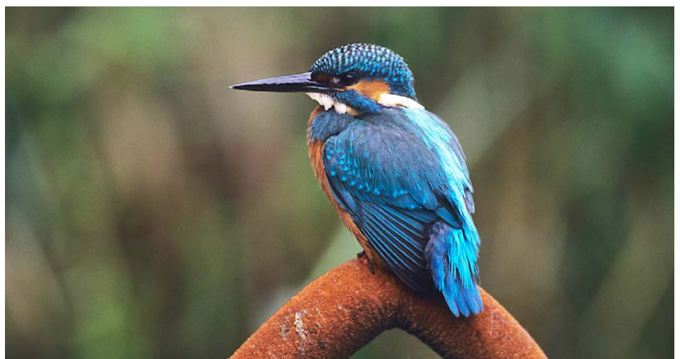
Sein Gefieder ist eine Pracht, sie kann von türkis bis grün leuchten