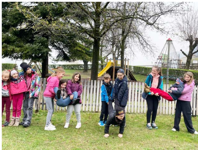
Die Kinder beim Bewältigen einer Aufgabe auf dem Weg zum Schatz.

Am 30.März fand unsere Osteraktion statt, die heuer etwas anders geplant und gestaltet wurde als gewohnt. Viele Kinder haben mit Freude und Motivation an der „Osterschnitzeljagd“ teilgenommen. Dabei galt es verschiedene Rätsel zu lösen, Fragen zu beantworten und Spiele zu gewinnen, um die nächsten Hinweise suchen zu können. Gemeinsam als Team haben es die Kinder schließlich geschafft, den Schatz zu finden und es war für jeden und jede ein kleiner Ostergruß und etwas zum Naschen dabei.