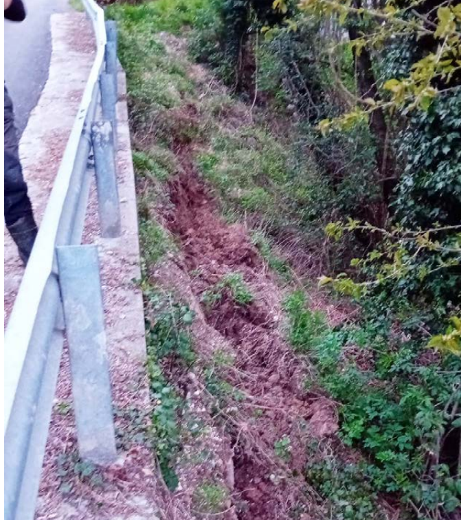
Die Schadstelle in Hinterglen