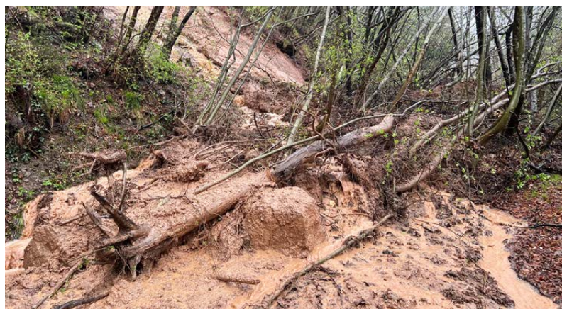
Die Zufahrt zum Schloss Enn wurde durch eine Hangmure versperrt