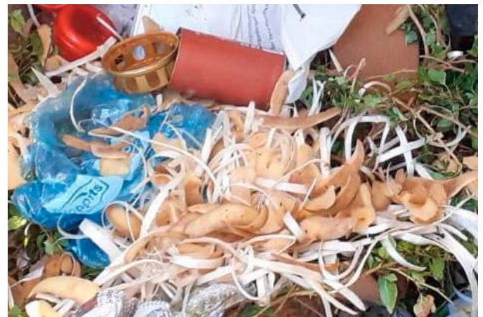
Allerlei Küchenabfall zwischen Grabkerzen u.Ä. im Müllcontainer am Pinzoner Friedhof

Dass weder Kartoffel- und Spargelschalen oder anderer Hausmüll in den Müllcontainer vom Friedhof gehören, versteht wohl jedes Kind. Und dennoch kommt es immer wieder vor, dass unverantwortliche Bürger allerlei Müll im Friedhofcontainer in Pinzon entsorgen und so unnötige Kosten für die Allgemeinheit bewirken. Wir ersuchen dies dringend zu unterlassen und den eigenen Müll fachgerecht zu entsorgen.