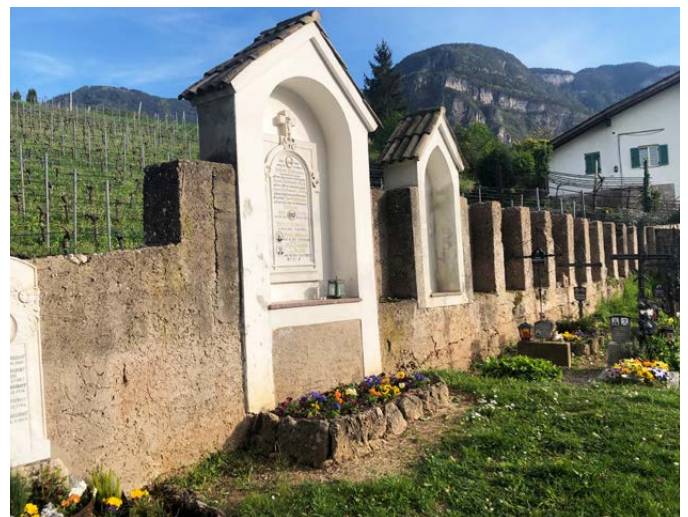
Die Friedhofsmauer von Pinzon vorher und nachher