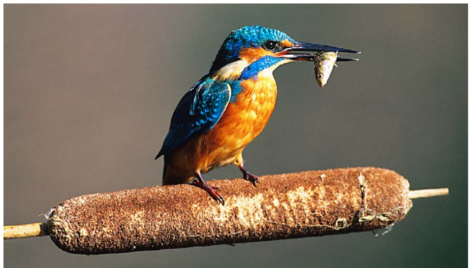
Eisvogel mit erbeutetem Fisch